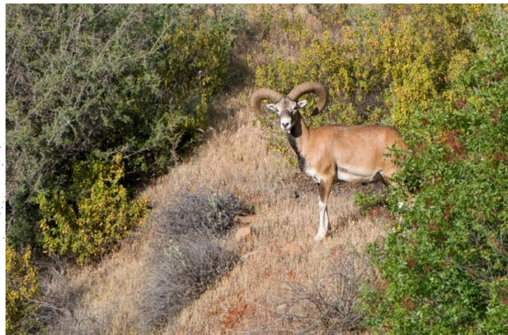
Photo 8. The Cyprus Mouflon