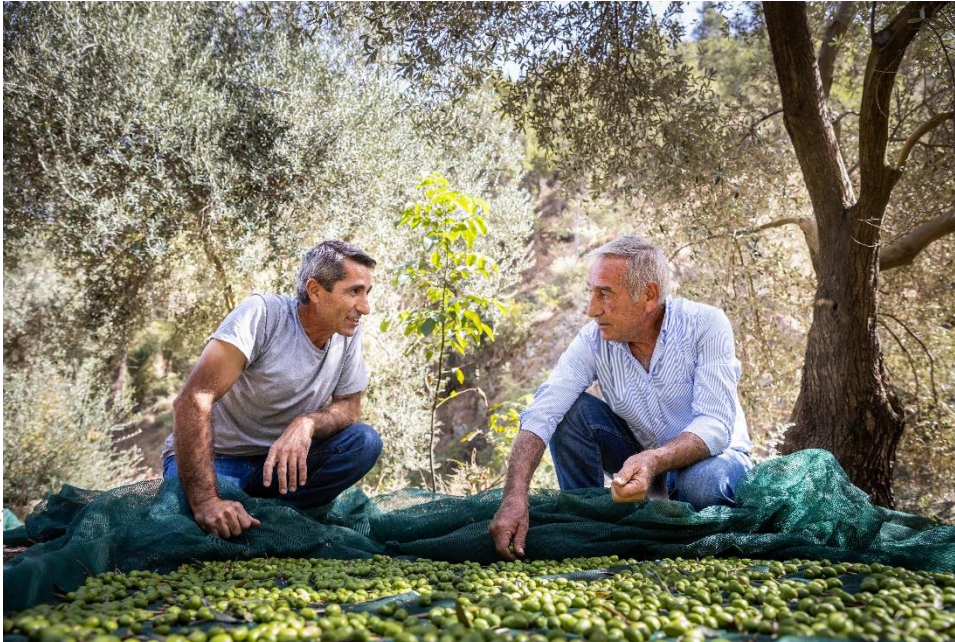
Photo 5. Our own orchard which supplies the hotel with fresh fruits and vegetables.