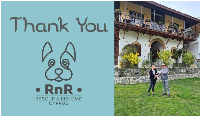
Photo 13. Donation to RnR Cyprus dog shelter