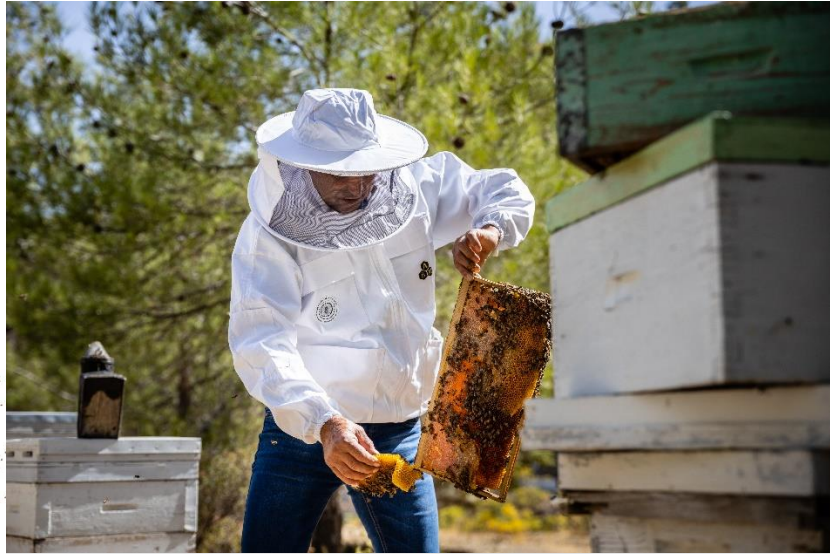
Photo 12. Beekeeping