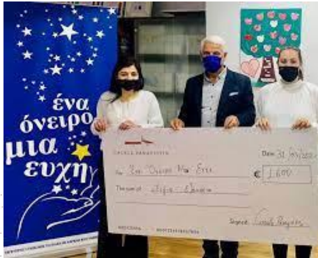
Photo 10. Donation for One Dream One Wish Foundation